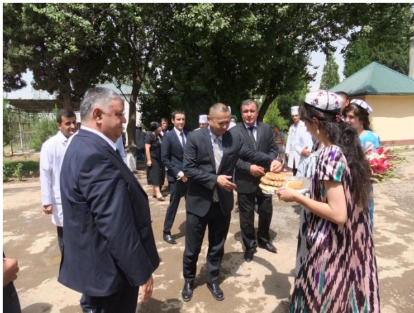
Работники больницы встречают гостей в традиционной форме приветствия

С успешным завершением проекта, здание хирургического отделения центральной больницы было полностью отремонтировано, кроме этого, хирургическому отделению были предоставлены новейшие медицинские оборудования, такие как операционный стол, аппарат ИВЛ, электрический коагулятор и другие.