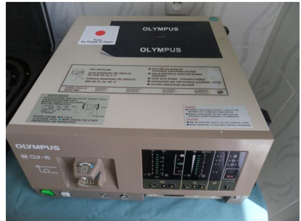
Гастрофиброскоп производства Японии, был предоставлен в рамках проекта