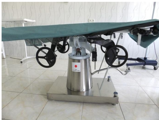
Новый операционный стол