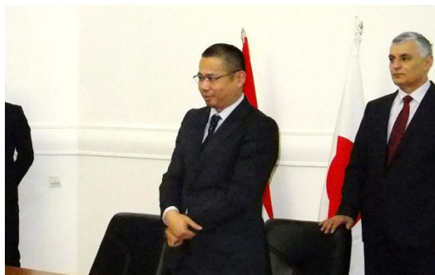
Вступительное слово Посла Японии Такаши Камада на открытии церемонии