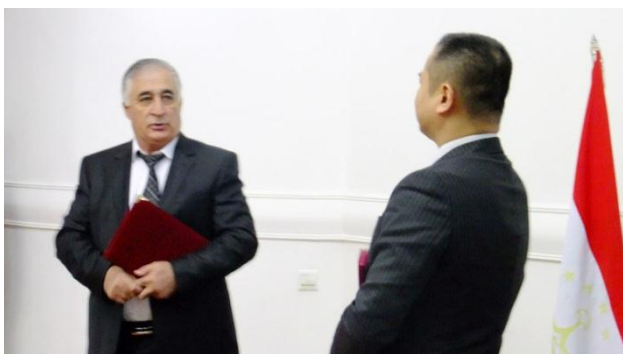
Все председатели выразили признательность за поддержку.