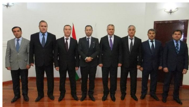
Посол Японии Такаши Камада вместе с председателями 7 районов Таджикистана