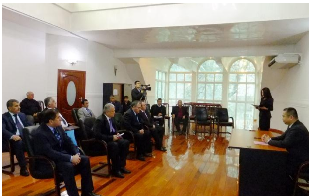
Церемония подписания соглашений в Посольстве Японии в РТ