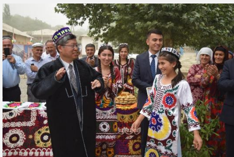
Мақтаби рақами 8 дар деҳаи Зарнисор