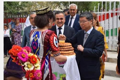
Мақтаби №35 дар деҳаи Боғистон