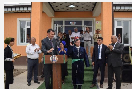
Мақтаби № .38 дар деҳаи Гултеппа