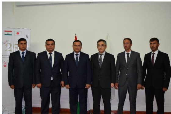
式終了後、署名者及び関係者らと並ぶ臨時代理大使。