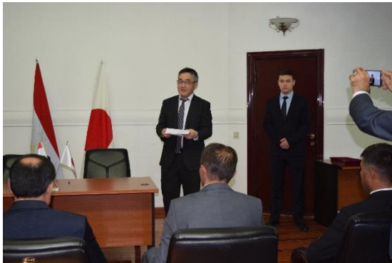
式冒頭、式辞を述べる臨時代理大使。

日本は防災支援に力を入れており、これら4案件も過去の豪雪被害を受けて実施されることになりました。タジキスタン全土の特に積雪が多い地域の除雪作業を円滑に行うために除雪車が供与され、タジキスタンの中でも特に厳しい気候条件下で暮らす人々の生活環境改善に貢献します。式中、被供与団体の代表者から、日本の支援に対する大きな感謝の意が示され、今後責任を持って案件実施に取り組む旨が述べられました。